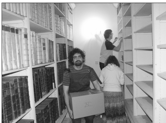
Teológusok segítenek a műemlékkönyvtár átrendezésében