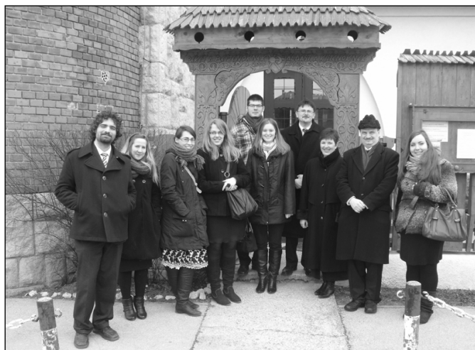
Teológusnapon a tatabányai templom előtt