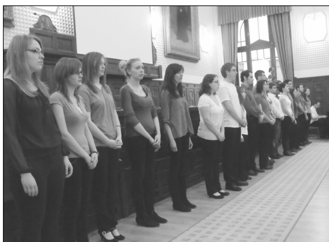
Március 15-i műsor az első évfolyam részvételével