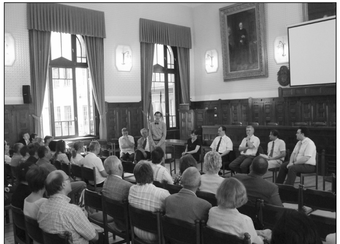
„Szülői értekezlet” a teológiára járó diákok számára