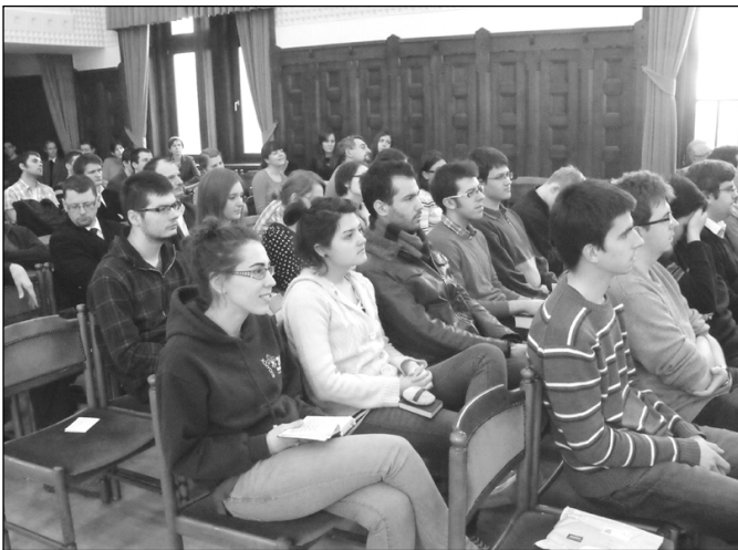
Exhortációs istentisztelet a teológián