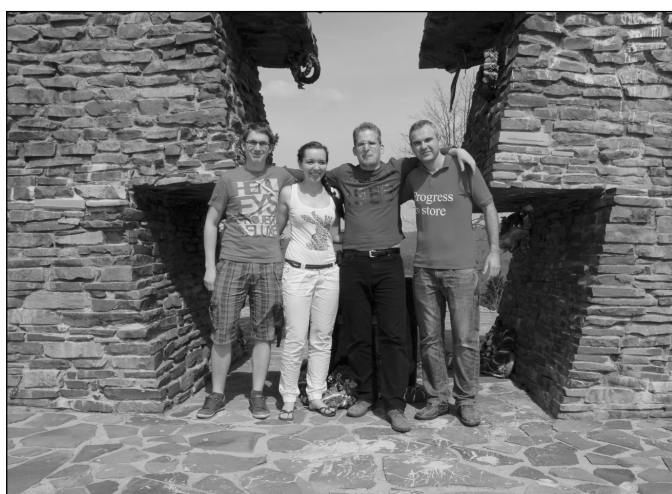
Teológusok a Vereckei-hágónál